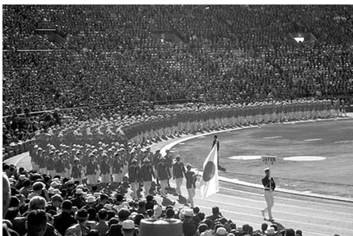
奇跡の戦後復興がはじまり、東京オリンピックで日本が一体となった (昭和39年10月10日開会式)

日時 平成19年 4 月 4 日(水) 午後6時半～8時半(午後6時15分開場) 会場 文京シビックセンター・小ホール 東京都文京区春日1-16-21 文京区役所内 (TEL 03-5803-1100) 入場料 無料(400名、先着順)